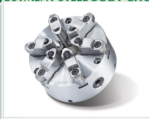
規格表 » Specifications